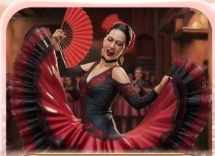
ระบำฟลามิงโก