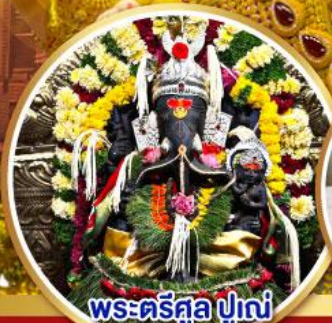
พระตรีศูล ปูणे (Trishul Pune)