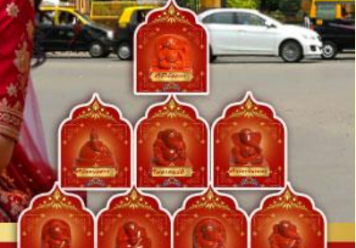
พระพิฆเนศ 8 องค์ เมืองปูणे