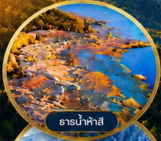
ธารน้ำห้ำสี่