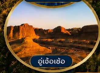
อู่เจ้อเซ่อ