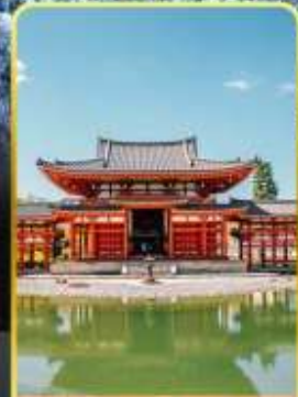
วัดเมียวโด้อิน