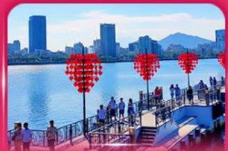
สะพานแห่งความรัก