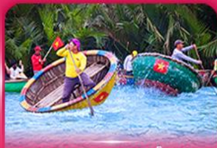
ส่องเรือกระดัง หมู่บ้านกิมทาน