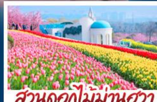
สวนดอกไม้ม้าฮวา