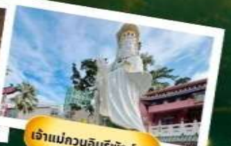
เจ้าแม่กวนอิมริพัลส์เบย์