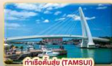
ท่าเรือคันทันซุย (TAMSUI)