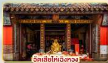
วัดเสี่ยวไห่เจิงหวง