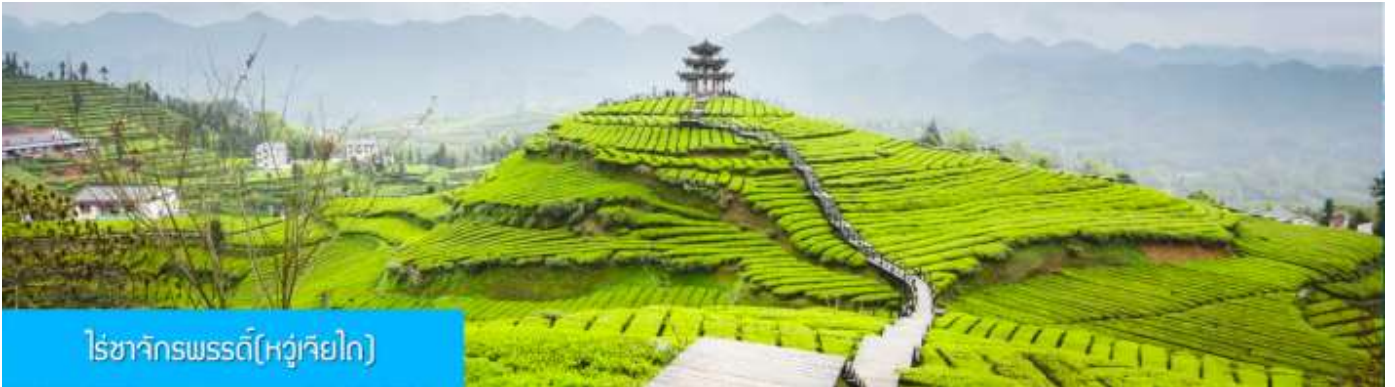
ไรชาจักรพรรดิ(หวู่เกียโก)