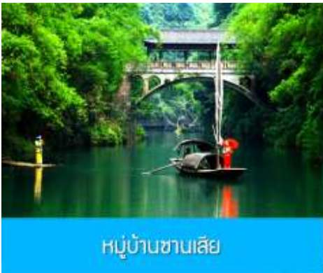
หมู่บ้านซานเสี