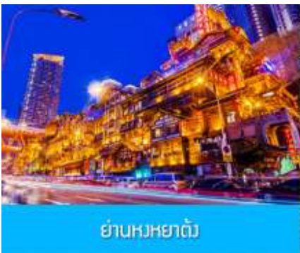
ย่านหงหยาดัง