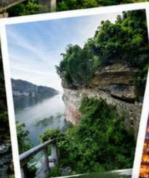
สวนถ้ำสามสหาย อุทยานท่องเที่ยวระดับ4A