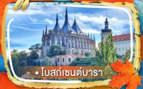
• โบสถ์เซนต์บารา

06-13, 09-16 ต.ค. 69 29 พ.ย. - 06 ธ.ค. 69 05-12 ธ.ค. 69 28 ธ.ค. - 04 ม.ค. 70