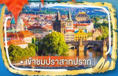
• เข้าชมปราสาทปราก