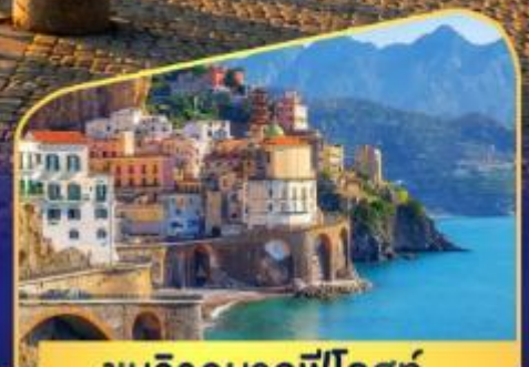
ชมวิวมาลฟิโคสก์