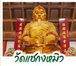
วัดเซกซงฮิว