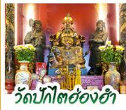
วัดปิกโตย่องฮา