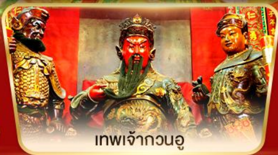
เทพเจ้ากวนอู