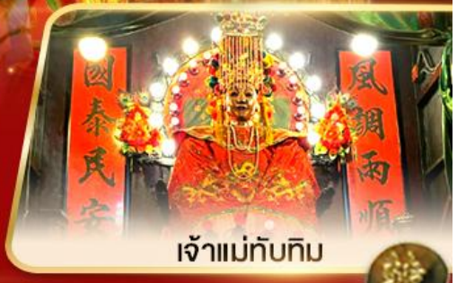
เจ้าแม่ทับทิม