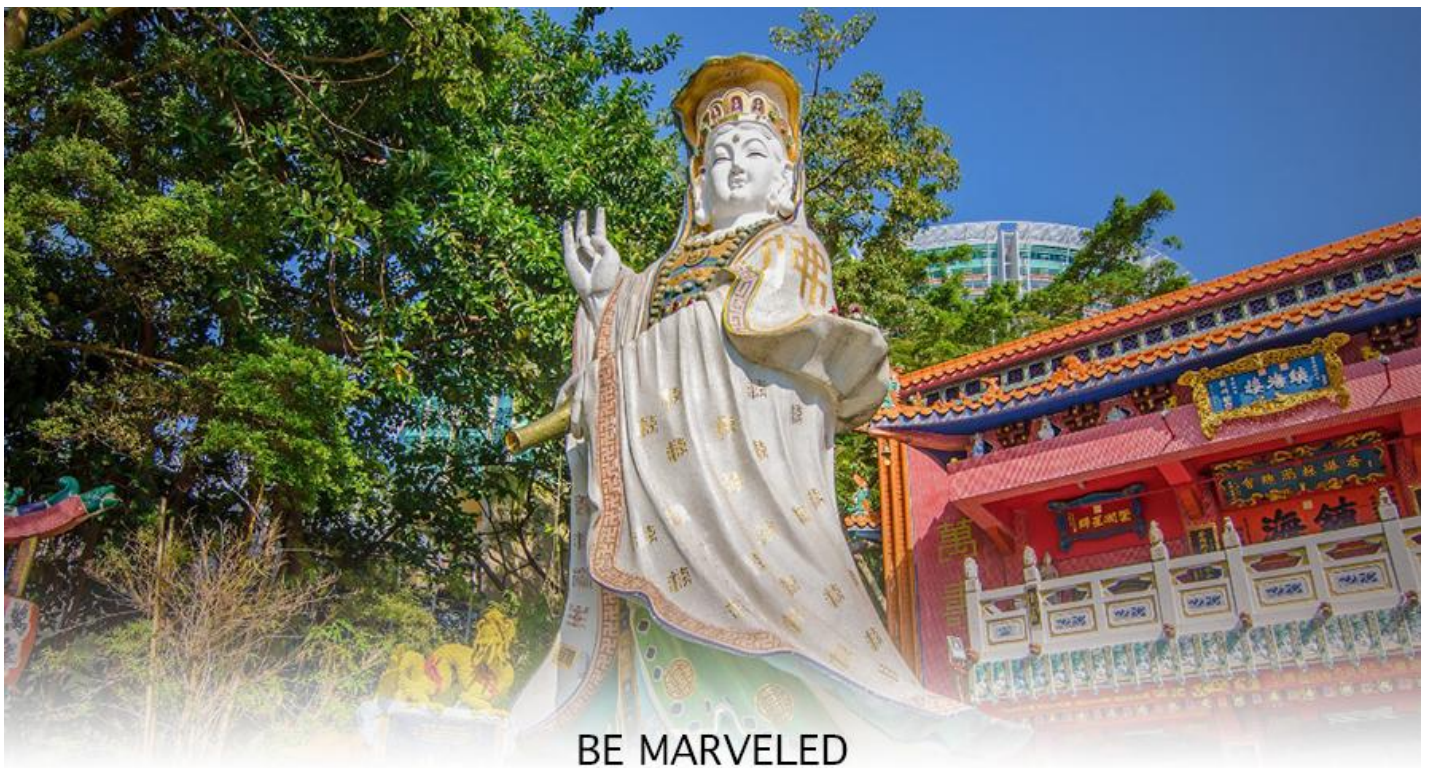
BE MARVELED วัดเจ้าแม่กวนอิมริปลัสเบย์

เรื่องการเงิน และขอพรขอ โชคลาภเพื่อเป็นสิริมงคลและขอพร เจ้าแม่ทับทิม หรือ เทพธิดาแห่งท้องทะเล ซึ่งทำหน้าที่ปกป้องคุ้มครองชาวประมง ตั้งโดดเด่นอยู่ท่ามกลางสวนสวยที่ทอดยาวลงสู่ชายหาดให้ท่านนมัสการขอ และนำท่านเดินข้าม สะพานต่ออายุ ซึ่งเชื่อกันว่าข้ามหนึ่งครั้งจะมีอายุเพิ่มขึ้น 3 ถ้าข้ามแล้วห้ามเดินย้อนกลับไปเด็ดขาด เพราะคนฮ่องกงเชื่อว่าชีวิตจะสั้นลงไป 3 ปี สำหรับคนโศกจะนิยมขอพรกับ เทพเจ้าแห่งความรัก ให้เอามือลูบที่บริเวณหินสีดำ พร้อมกับอธิษฐานให้สมหวังกับความรัก ปิดท้ายด้วยการรับพลังสงฆ์จาก ศาลา แปะติต ซึ่งถือเป็นจุดรวมรับพลัง ถือเป็นจุดที่มีพลังจิตที่สุดของเกาะฮ่องกง และยังมีรูปปั้นองค์เทพอีกมากมายภายในวัดแห่งนี้ให้กราบไหว้ขอพร