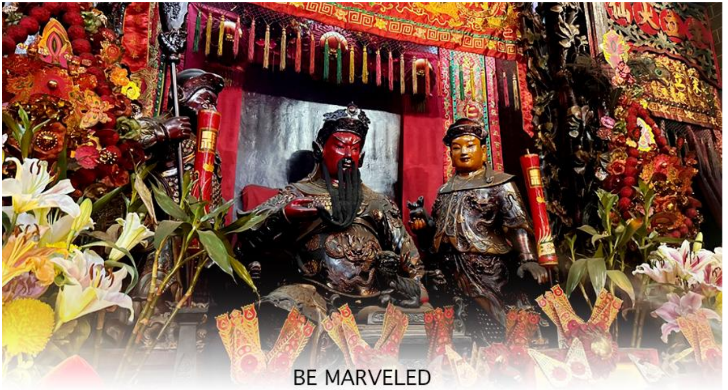
BE MARVELED วัดกวนอู

ดวงไม่ให้เพลิงพลังแก่ศัตรู ทำให้มีมิตรที่ซื่อสัตย์ และคุ้มครองบริวารให้ก้าวหน้าและอยู่เย็นเป็นสุข ซึ่งผู้ประกอบอาชีพ ตำรวจ ทหาร และ นักการเมือง จึงมักจะนิยมบูชาเทพเจ้ากวนอู เป็นพิเศษ