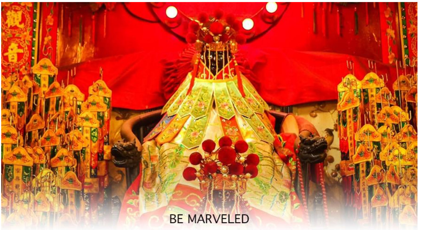
BE MARVELED วัดเจ้าแม่กวนอิมฮ่องฮ่า (ยิมจิน)

ถูกสร้างขึ้นในปี ค.ศ. 1873 ด้วยสถาปัตยกรรมแบบวัดจีนดั้งเดิม ในทุกๆ ปี จะมีนักท่องเที่ยวทุกเชื้อชาติจากทั่วโลกแวะเวียนมากราบไหว้ รวมถึงมาร่วมพิธีเยี่ยมเงิน เจ้าแม่กวนอิมฮ่องฮ่า หรือ วันเปิดทรัพย์ ซึ่ง 1 ปีจะมีฤกษ์ดีแค่ 1 วันเท่านั้น ปี 2569 เป็นวันที่ 14 มีนาคม 2569 นี้การทำพิธีเยี่ยมเงินเจ้าแม่กวนอิม วันเปิดพระคลัง หรือ วันเปิดทรัพย์ เป็นความเชื่อของคนเชื้อสายจีน ทั้งฝั่งฮ่องกง และมาเก๊าถือเป็นพิธีศักดิ์สิทธิ์ในการขอพรเจ้าแม่กวนอิม เชื่อกันว่าเป็นการไหว้และการทำพิธีที่ช่วยเสริมดวงให้เงินทองไหลมาเทมา การขอยืมเงินองค์กรกวนอิมที่ขึ้นชื่อเรื่องความเมตตา หรือทำการค้า เปิดธุรกิจค้าขายเจริญรุ่งเรือง