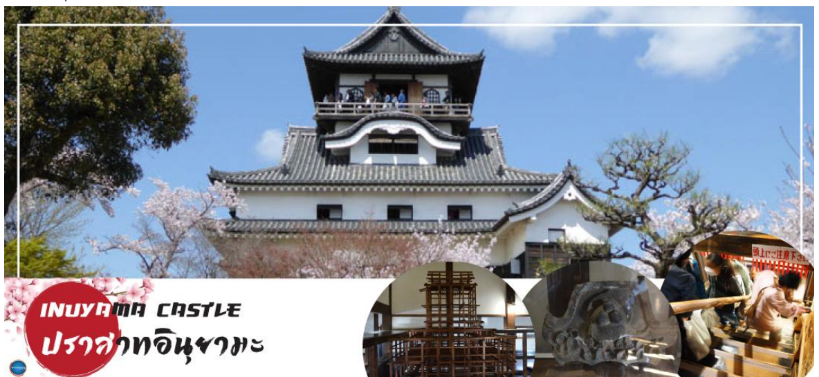
INUYAMA CASTLE ปราสาทอินยามะ

นำท่าน เข้าชม ปราสาทอินยามะ (Inuyama Castle) ตั้งอยู่ใจกลางเมืองอินยามะ ทางตะวันตกเฉียงเหนือของจังหวัดไอจิ ประเทศญี่ปุ่น เป็นปราสาทที่สร้างขึ้นในตอนปลายศตวรรษที่ 16 ที่อยู่รอดมาจนถึงปัจจุบัน ปราสาทแห่งนี้มีความพิเศษตรงที่มีหอคอยที่มีความเก่าแก่ที่สุดในประเทศ ดังนั้นปราสาทแห่งนี้จึงได้รับการประกาศให้เป็นสมบัติของชาติ ด้านในของปราสาทมีการจัดแสดงอาวุธในการทำสงครามในสมัยต่าง ๆ ของญี่ปุ่น และเราสามารถเดินขึ้นไปด้านบนเพื่อชมความงามของตัวเมืองอินยามะ ตลอดจนแม่น้ำคิโซะ และที่ราบโนบิได้