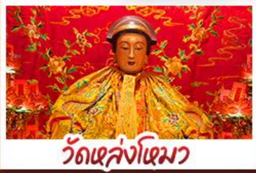
วัดเข่งไฉมา