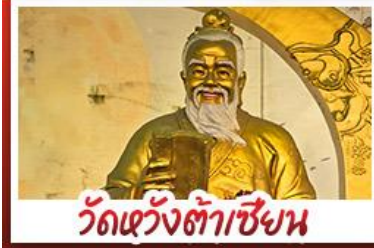
วัดเขว้งต้าเซียน