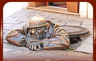
แลนด์มาร์คดัง รูปปั้นคูนิล ปรากติสลาวา