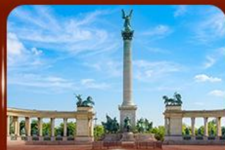
จัตุรัสวีรบุรุษ บูดาเปสต์