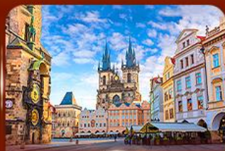
ชมย่านเมืองเก่า ปราก