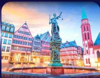
จัตุรัสโรเมอร์ แพรงก์เฟิร์ต