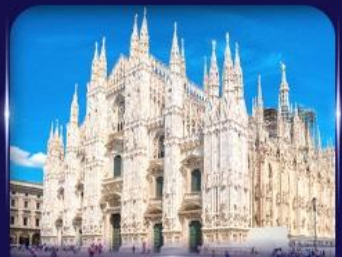
เซนต์มาร์กาเรต มิลาโน