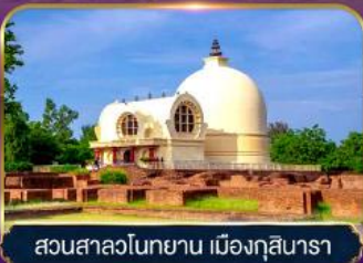
สวนสาละวินทโยน เมืองกุสินารา