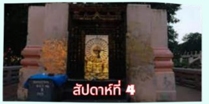
รัตนขรรเจดีย์ (ซุ้มเรือนแก้ว)

เรียบร้อยแล้ว นำคณะจาริกบุญสวดมนต์ทำวัตรเย็น บูชาพระรัตนตรัย และสวดมนต์บูชาสังเวชนียสถาน จากนั้นเชิญท่านทำศนาธรรม นั่งสมาธิปฏิบัติบูชาตามอัยาศัย สมควรแก่เวลา นัดหมายเวลาเชิญท่านกลับโรงแรมที่พัก