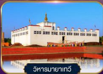
วิหารมหายาเทวี