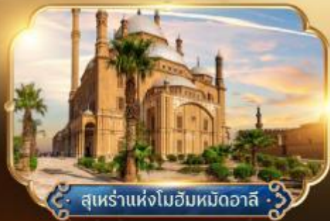
สุเหร่าแห่งโมฮัมหมัดอาลี