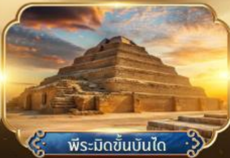
พีระมิดขั้นบันได