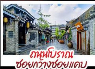
ถนนโบราณ ชอยกว้างชอยแคบ