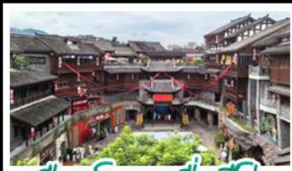
เมืองโบราณฉือซีโจว

อุทยานสี่ครุฑ - อุทยานเขานางฟ้า อุทยานหลุมบ่อฟ้า - เมืองโบราณฉือซีโจว หลงหยินเทียนเจิง - หงหยาดัง