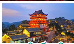
ตงหยินเทียนเจิง