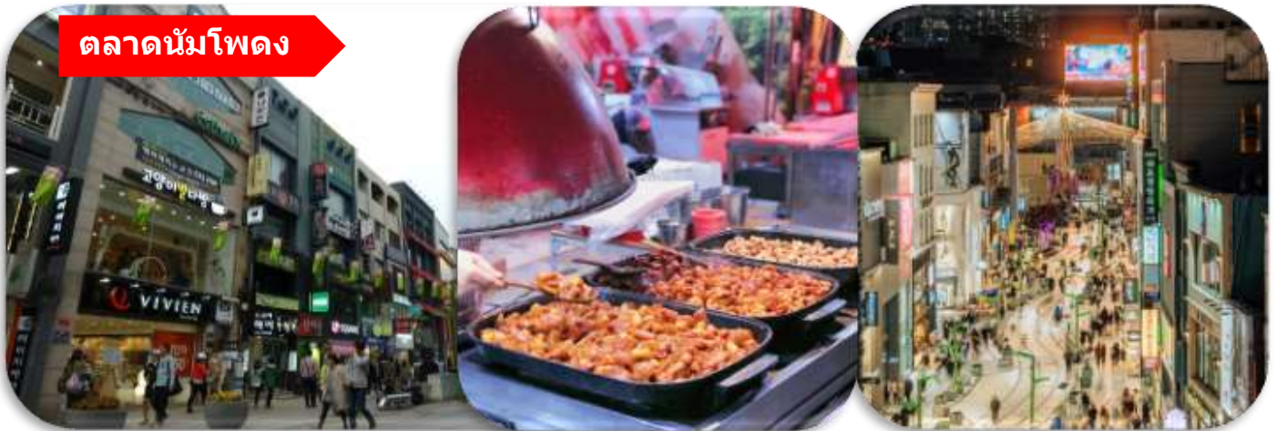
ตลาดนัมโพดง

เดินทางต่อไปยัง ตลาดนัมโพดง (Nampo-dong Market) แหล่งช้อปปิ้งชื่อดังใจกลางเมืองปูซาน เต็มไปด้วยร้านค้าแฟชั่น ของฝาก สตรีทฟู้ด และบรรยากาศคึกคักตลอดทั้งวันนักท่องเที่ยวสามารถเดินเล่นชิมอาหารท้องถิ่น และสัมผัสวิถีชีวิตเมืองเก่าที่ผสมผสานความทันสมัยได้อย่างลงตัว