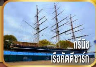
กรีนวิช เรือคัตตีซาร์ก

ชมเมืองลิเวอร์พูล พร้อมถ่ายรูป หน้าสนามแอนฟิลด์