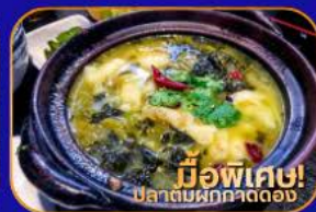
มีอเฟิเด! ปลาต้มผักกาดดอง