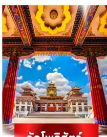
วัดโพธิ์สัตว์