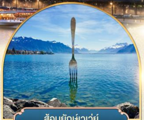
ล้อมยักเข่าเว่ย