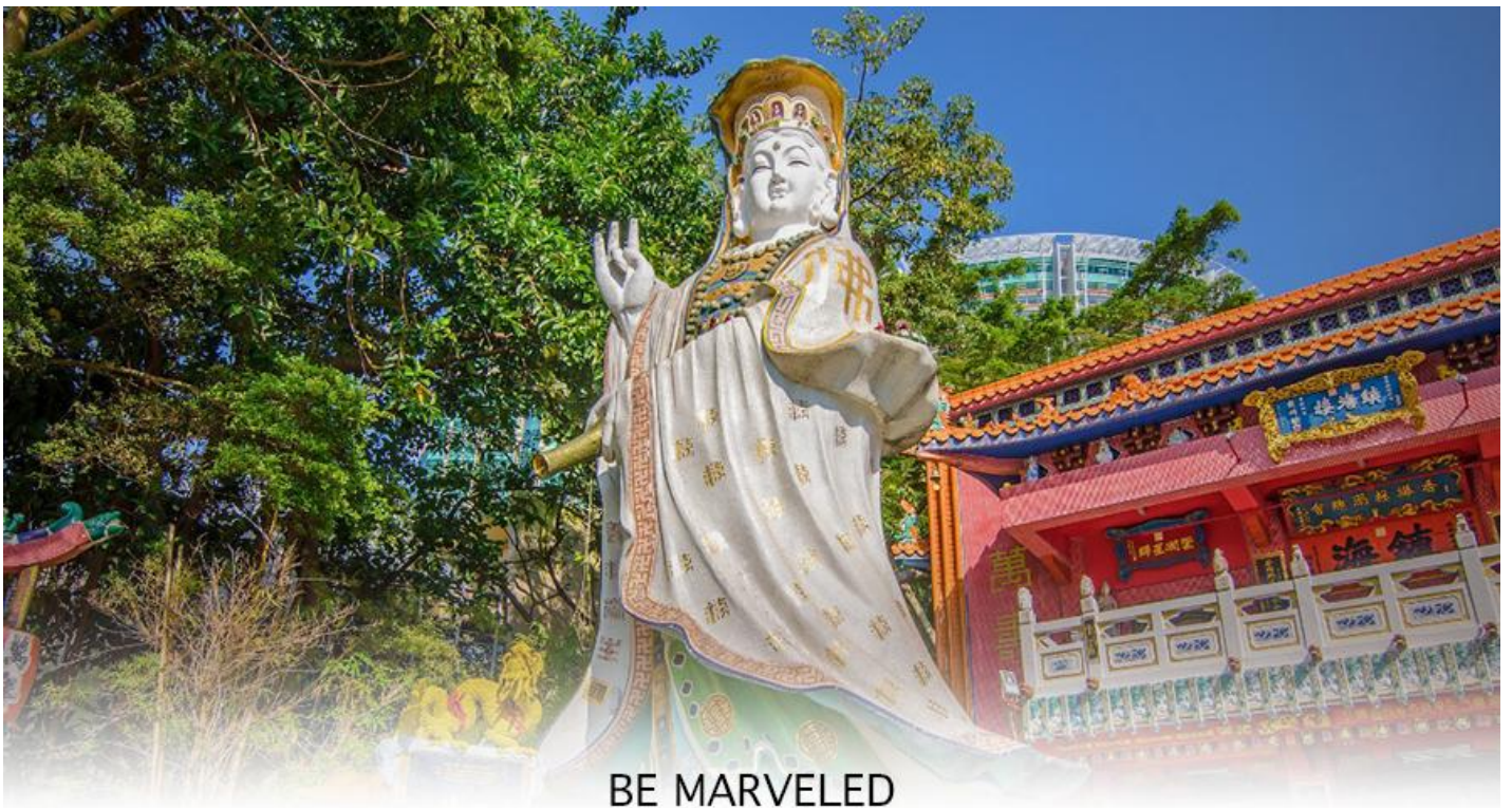
BE MARVELED วัดเจ้าแม่กวนอิมรีพัลส์เบย์

จากนั้นนำท่านเดินทางสู่ ชายหาดรีพัลส์ เบย์ (REPULSE BAY) หาดทรายรูปจันทร์เสี้ยวแห่งนี้เป็นหาดที่สวยงามที่สุดแห่งหนึ่งในฮ่องกง และยังใช้เป็นฉากในการถ่ายทำภาพยนตร์หลายเรื่อง ถือเป็นแหล่งท่องเที่ยวยอดนิยมในหมู่ชาวฮ่องกง นักท่องเที่ยวที่นิยมมาสักการะที่ วัดทินฮั่ว อ่าวรีพัลส์เบย์ (TIN HAU TEMPLE REPULSE BAY) ซึ่งตั้งอยู่ริมทะเล เป็นสถานที่ท่องเที่ยวสำคัญ สร้างขึ้นในปี ค.ศ.1993 มีรูปปั้นของ เจ้าแม่กวนอิม ปางประทานพรตั้งอยู่ ซึ่งคนฮ่องกงและคนจีนให้ความเคารพนับถือมากที่สุด เชื่อว่าเป็นเทพที่มีความศักดิ์มากขอพรเรื่องงานการเงิน และขอพรขอโชคลาภเพื่อเป็นสิริมงคล และขอพร