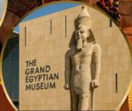
พีพีรภัณฑ์แกรนด์อียิปต์