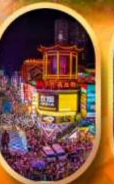
ถนนคนเดินชิงสวี่