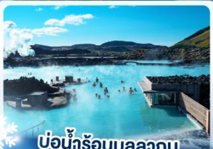
แช่น้ำร้อนบลูลากูน

เก็บไอซ์แลนด์ แคนกูนาไฟร์กจูพล และ แช่น้ำร้อนบลูลากูน