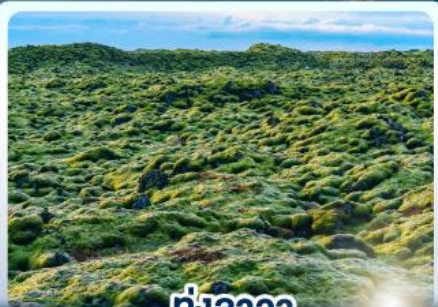
ทุ่งลาวา