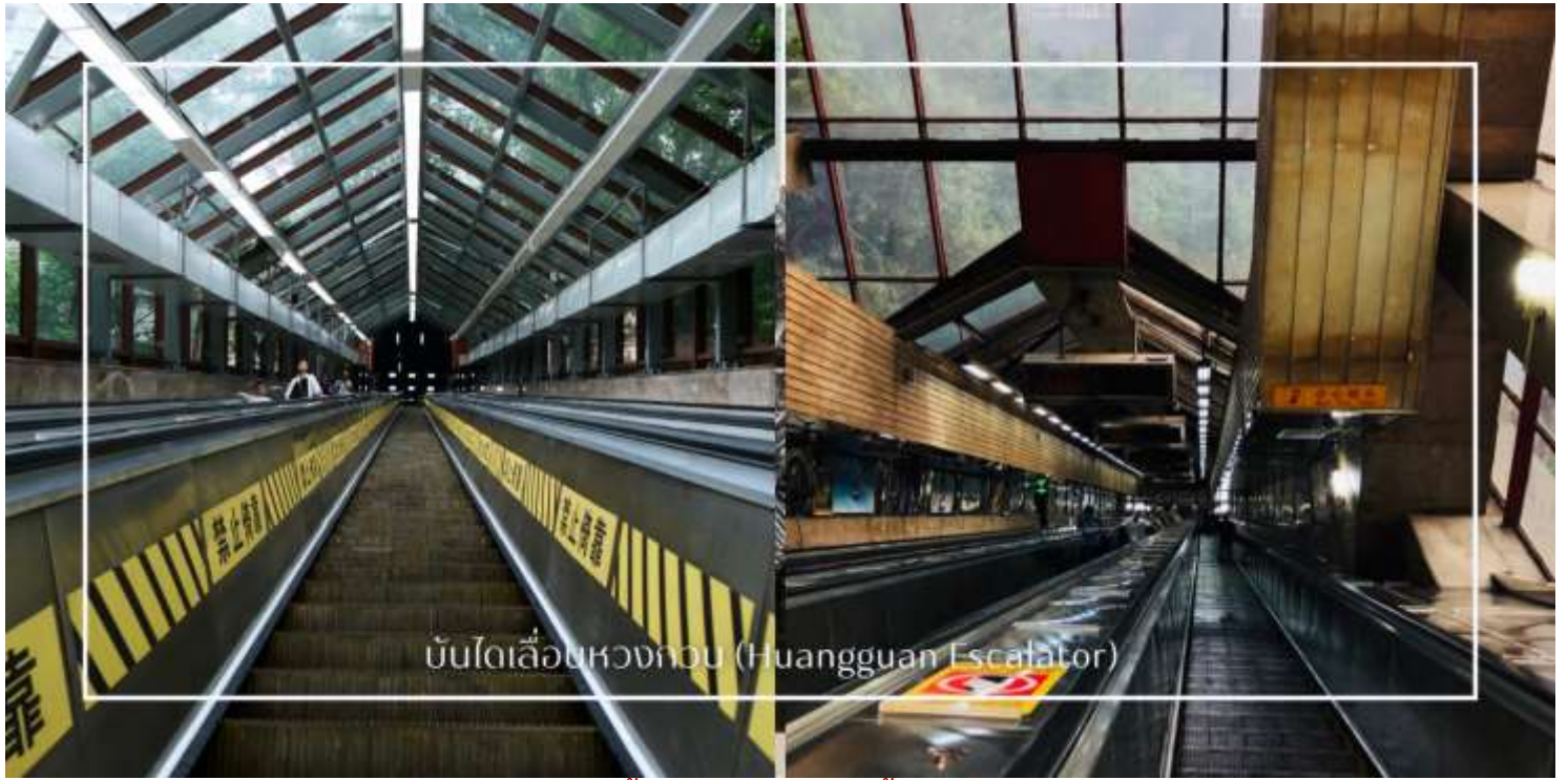
บันไดเลื่อนหวงกวน (Huangguan Escalator)

เที่ยง บริการอาหารเที่ยง ณ ภัตตาคาร (มื้อที่8) เมนูพิเศษ : สุกี้หม่าล่า