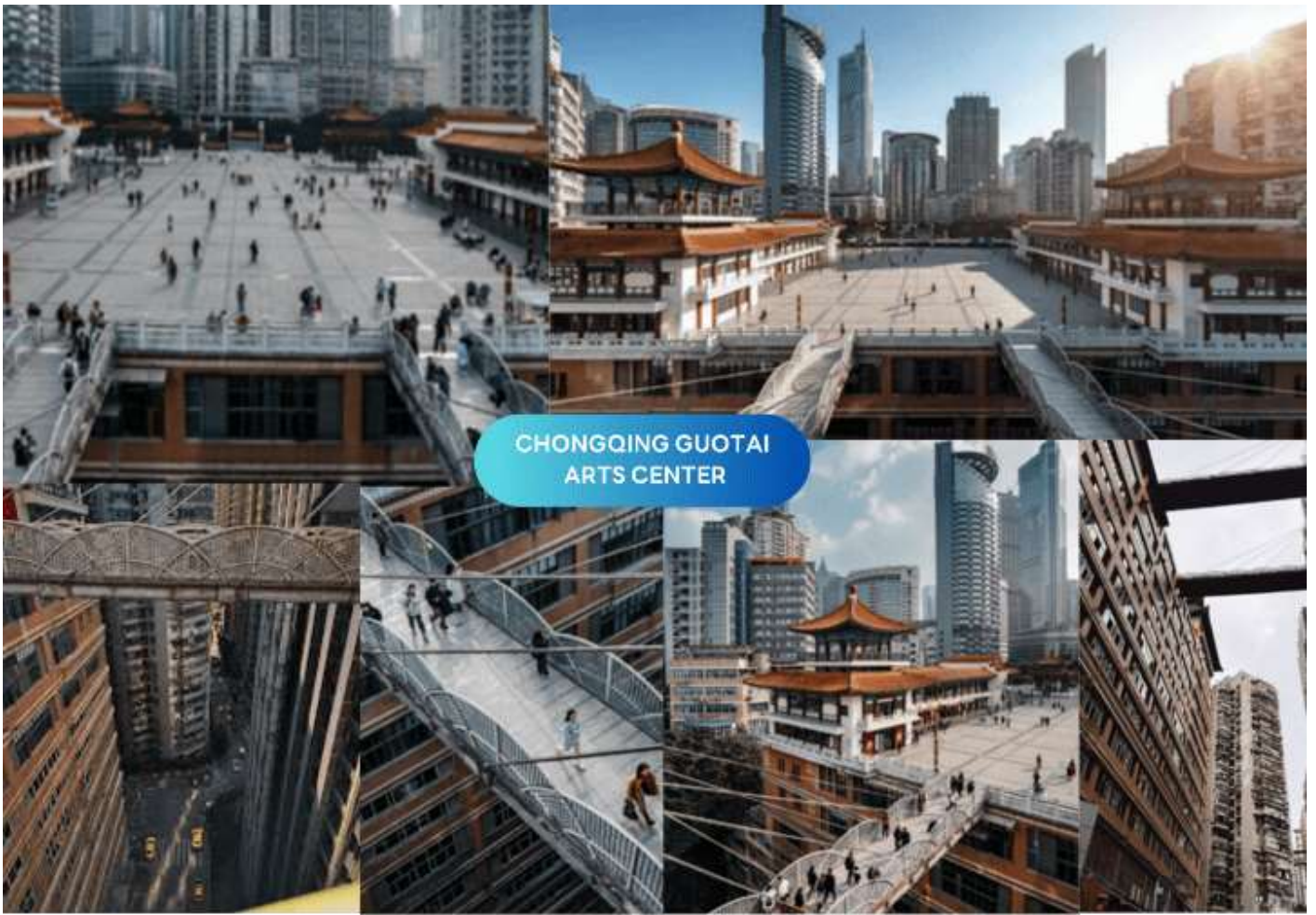
CHONGQING GUOTAI ARTS CENTER