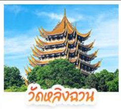
วัดเลิ่งฉวน