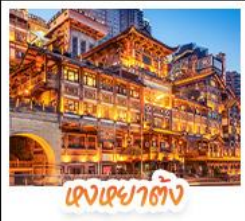
ตึกเซาตัง

สัมผัสใบไม้แดงสุดงดงามที่ ภูเขาหมื่นชางชาน และ ภูเขากวงอู๋ชาน ชมวิวกว้างคืนสุดอลังการที่ หงหยาดัง แลนด์มาร์กชื่อดังแห่งฉางชิ่ง สักการะพระโพธิสัตว์เจ้าแม่กวนอิม ณ วัดหลิงอว่น ขอพรเสริมสิริมงคล ช้อปปิ้งแลนด์มาร์กสุดฮิต แพนด้าปิ่นตึก IFS + POP MART ช้อปปิ้งจุใจที่ ไท่กุ่หลี่ ถนนคนเดินชุนชู่