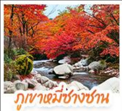
ภูเขาหมื่นชางชาน