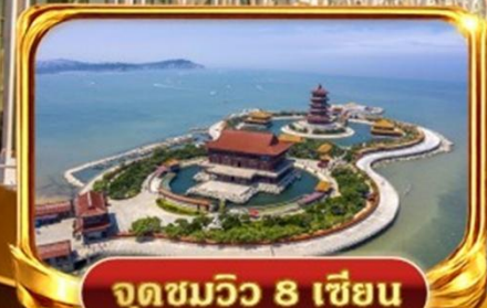
จุดชมวิว 8 เซียน