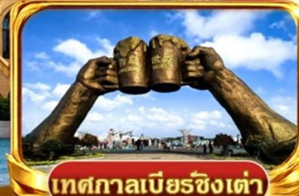
เทศกาลเบียร์ชิงเต่า