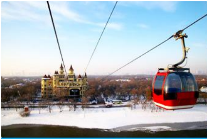
นั่งกระเช้าชมแม่น้ำซวงเวาเจียง

พักที่ VIENNA INTER HOTEL โรงแรมระดับ 4 ดาวท้องถิ่น ในเมืองเมืองซ่งจี้