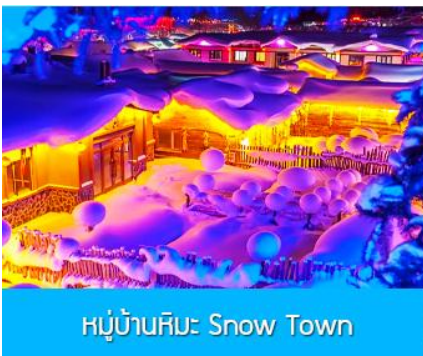
หมู่บ้านหิมะ Snow Town

ท่ามกลางท้องทุ่งและผืนป่าที่ปกคลุมด้วยหิมะราวกับอยู่ในโลกแห่งเทพนิยาย ผ่านหมู่บ้าน เว่ยหูจ้าย 威虎寨 ที่อดีตเคยเป็นที่ตั้งของรังโจรที่มักออกปล้นสะดมชาวบ้าน ม้าลากเลื่อนเป็นยานพาหนะเฉพาะพื้นที่ ๆ ที่นิยมนำมาใช้ในการเดินทางหรือลำเลียงสิ่งของในช่วงฤดูหนาว ที่ใช้ม้ามาลากจูงแคร่เลื่อนให้สามารถเคลื่อนย้ายบนลานหิมะได้