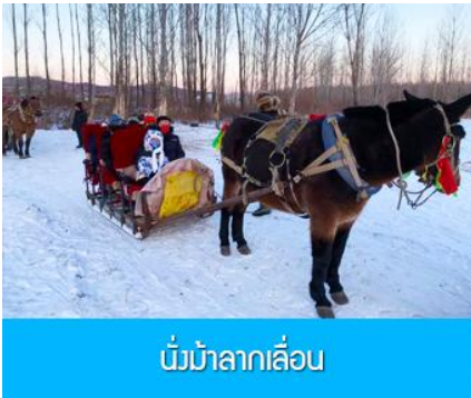
นั่งม้าลากเลื่อน

เที่ยง รับประทานอาหารกลางวัน ณ ภัตตาคาร (5)