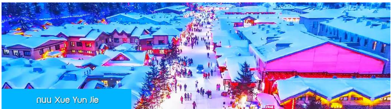
ถนน Xue Yun Jie