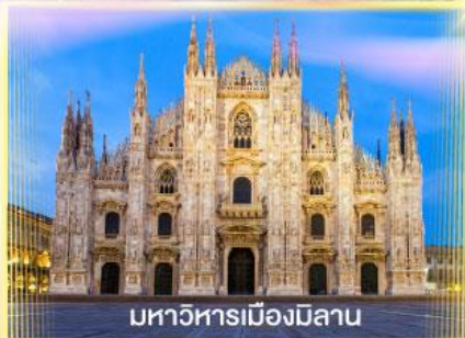
มหาวิหารเมืองมิลาน