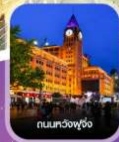
ถนนทวิงฟู่จิ่ง