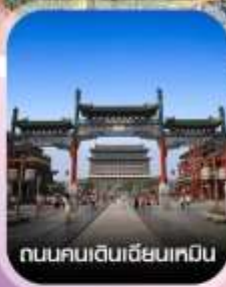
ถนนคนเดินเฉียนเหมิน

✈️ คอนเฟิร์มออกเดินทาง ทุกพีเรียด 2 ท่านขึ้นไป