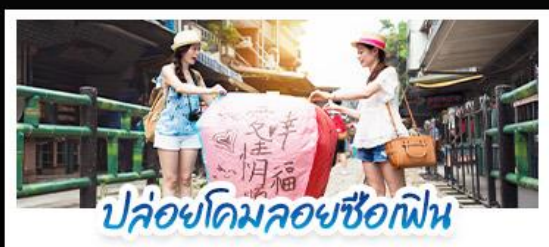
ปล่อยโดมลอยซิวเฟิน