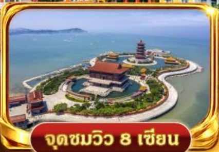
จุดชมวิว 8 เยียน