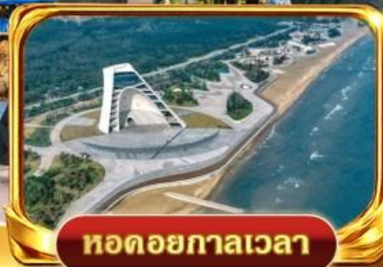
หอดอยกาลเวลา