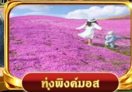
กุ่่งฟิงค์มอส