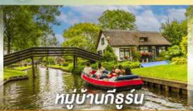
หมู่บ้านทีรูรัน