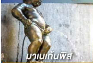
มานเนกันพิส