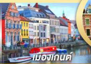
เมืองกันต์