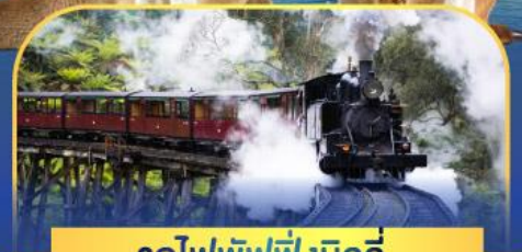
รถไฟพั้งบิลลี่

ล่องเรือชมอ่าวซิดนีย์พร้อมรับประทานอาหารกลางวัน และ เข้าชมสวนสัตว์การองก้า