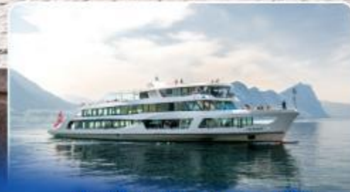
ล่องเรือทานอาหารกลางวัน ทะเลสาบลูเซิร์น