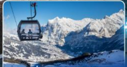
นั่งกระเช้าและรถไฟสู่ ยอดเขาจุงเฟรา