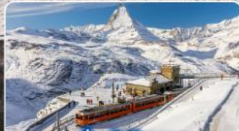
นั่งรถไฟสู่ยอดเขา กรอนเนอร์เกรต