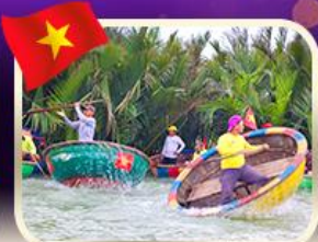
ล่องเรือกระด้งกิมทาน