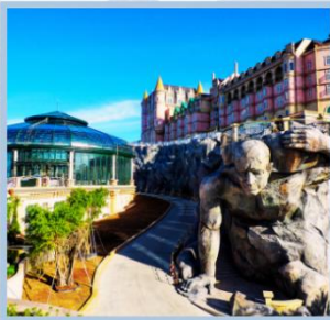
โซน Eclipse Square