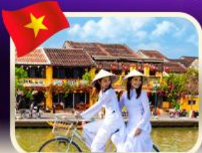
เซ็คอินเมืองเก่าฮอยอัน