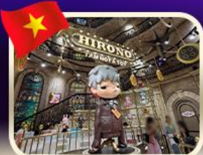
POPMART บานาฮิลล์