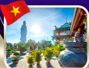
ขอพรกวณอิมวัดหลั่นอึ้ง