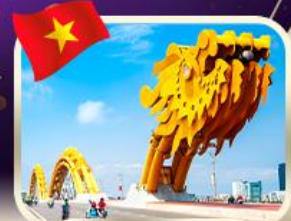
สะพานมังกร ดานัง