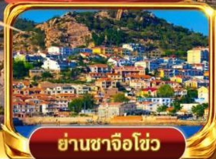
ย่านซาจื่อไฮ่