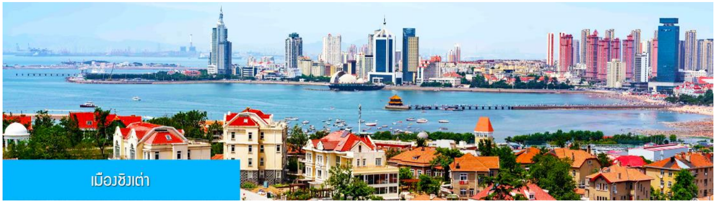
เมืองชิงเต่า