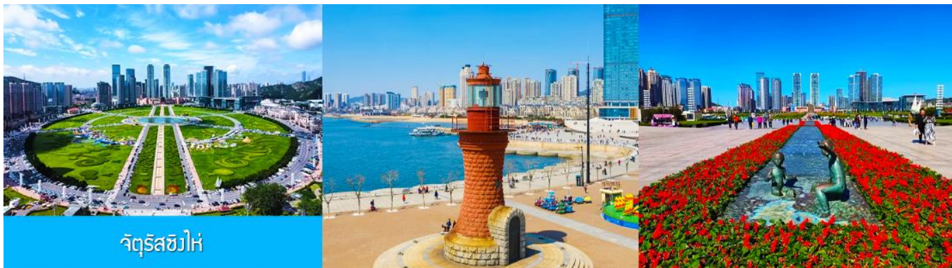
จัตุรัส星海

นำท่านเที่ยวชม จัตุรัส星海 星海广场 เป็นจัตุรัสขนาดใหญ่เป็นแลนด์มาร์คสำคัญของเมืองต้าเหลียน สร้างขึ้นเพื่อเฉลิมฉลองในโอกาสที่รัฐบาลอังกฤษคืนเกาะฮ่องกงในให้จีนในปี ค.ศ. 1997 ตั้งอยู่ชายฝั่งทะเลในเมืองต้าเหลียน เป็นจัตุรัสใจกลางเมืองที่ใหญ่ที่สุดในโลกและเป็นแลนด์มาร์คของเมืองต้าเหลียน รายล้อมด้วยตึกระฟ้าที่ทันสมัย ภายในมีบ่อน้ำพุดนตรี ลานหญ้าขนาดใหญ่ และลานกว้างสำหรับจัดกิจกรรมกลางแจ้ง อาทิ เทศกาลเปียร์นานาชาติ การแข่งขันวิ่งมาราธอน งานแฟชั่นนานาชาติเมืองต้าเหลียน ฯลฯ