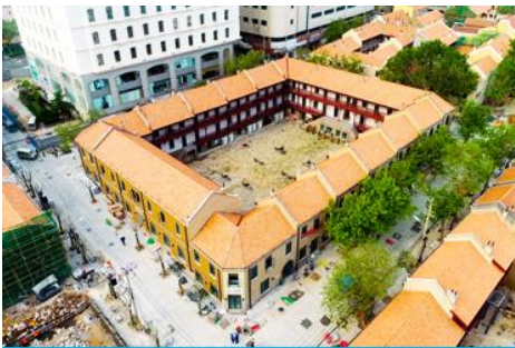
เมืองเก่าเยอรมัน ตรอกกว้างชิงหลี

จากนั้นนำท่านเดินเที่ยวชม ถนนจงซวน 中山路 ถนนที่เต็มไปด้วยกลิ่นอายยุโรป และถนนสายนี้มีบันทึกรื่องราวมากกว่าศตวรรษของเมืองชิงเต่าไว้ ที่นี่เป็นศูนย์กลางการค้าแห่งแรกที่เต็มไปด้วยสถาปัตยกรรมสไตล์ยุโรปเก่าแก่ที่ได้รับอิทธิพลมาจากเยอรมัน ให้ท่านได้เดินเก็บบรรยากาศ และ เก็บภาพกับ โบสถ์เซนต์ไมเคิล (ด้านนอก) โบสถ์แห่งนี้ที่คู่รักนิยมมาถ่ายภาพงานแต่งงานกันมากที่สุดในเมืองชิงเต่า ให้ท่านถ่ายรูปเก็บภาพ