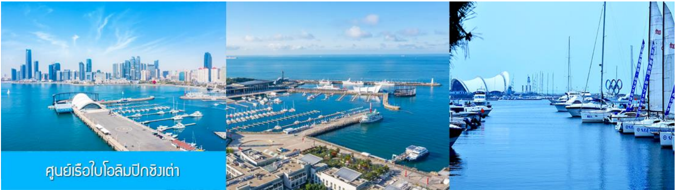
ศูนย์เรือใบโอลิมปิกชิงเต่า

จากนั้นนำท่านเที่ยวชม โรงเบียร์ชิงเต่า 青岛啤酒博物馆 พิพิธภัณฑ์เบียร์ที่ขึ้นชื่อของเมืองชิงเต่า ซึ่งเป็นเบียร์ยี่ห้อแรกที่ผลิตขึ้นในประเทศจีน ชมเบียร์ คอลเลกชันที่มียี่ห้อหลากหลายที่สุดของโลก และชมการจัดแสดงภาพและวิดิทัศน์เกี่ยวกับวิวัฒนาการของเบียร์ ขั้นตอนการผลิตและอื่น ๆ ที่เกี่ยวข้อง พร้อมชิมเบียร์ชิงเต่า ซึ่งเป็นเบียร์ที่ขายดีที่สุดในยี่ห้อหนึ่งของจีน.. (ชิมเบียร์ชิงเต่าท่านละ 1 แก้ว รับกลับอีก 1 ขวดเล็ก ตอนเดินออก)