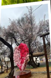
สวนแอปเปิ้ลคอก