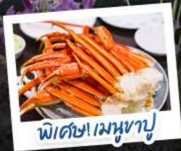
พิเศษ! เมฆาปู