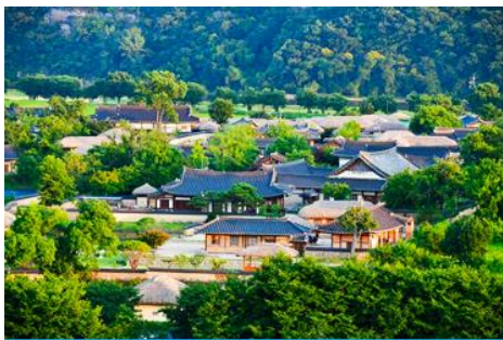
ศูนย์วัฒนธรรมเกาหลี

เช้า รับประทานอาหารเช้า ณ ห้องอาหารของโรงแรม (6)