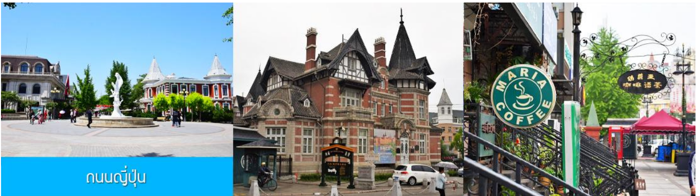
ถนนญี่ปุ่น