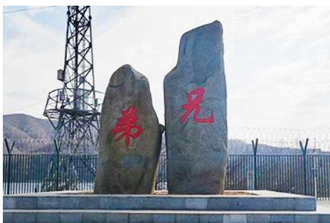
ป้ายพรมแดนจีนเกาหลีและแท่งศิลาสองพี่น้อง