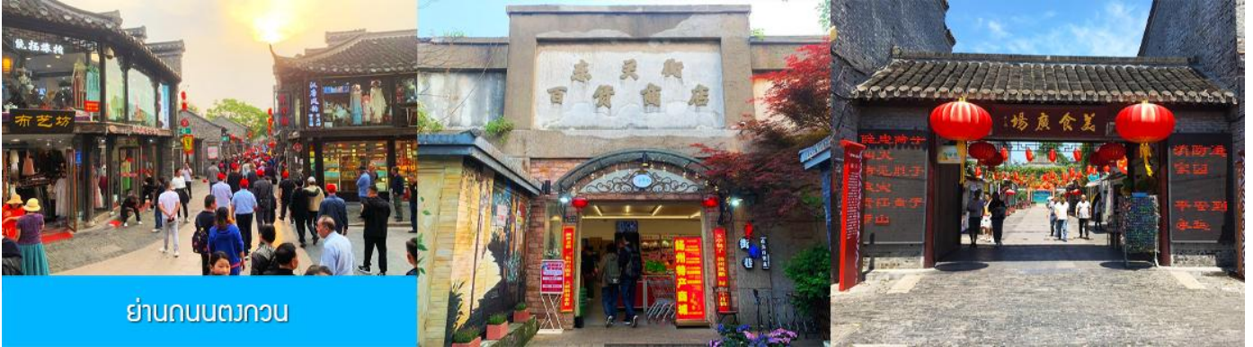
ย่านถนนตงกวน

ชม จัตุรัสชิงไห่ 星海广场 เป็นจัตุรัสขนาดใหญ่เป็นแลนด์มาร์คสำคัญของเมืองต้าเหลียน สร้างขึ้นเพื่อเฉลิมฉลองในโอกาสที่รัฐบาลอังกฤษคืนเกาะฮ่องกงในให้จีนในปี ค.ศ. 1997 ตั้งอยู่ชายฝั่งทะเลในเมืองต้าเหลียน เป็นจัตุรัสใจกลางเมืองที่ใหญ่ที่สุดในโลกและ เป็นแลนด์มาร์คของเมืองต้าเหลียน รายล้อมด้วยตึกกระจาที่ทันสมัย ภายในมีบ่อน้ำพุดนตรี ลานหญ้าขนาดใหญ่ และลานกว้างสำหรับจัดกิจกรรมกลางแจ้ง อาทิ เทศกาลเบียร์นานาชาติ การแข่งขันวิ่งมาราธอน งานแฟชั่นนานาชาติเมืองต้าเหลียน ฯลฯ