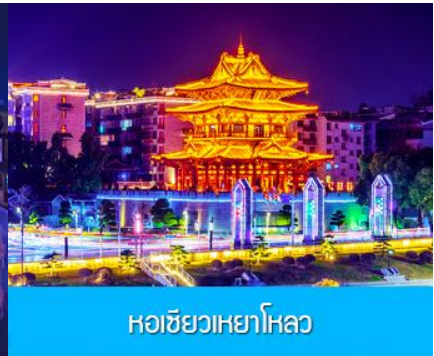
หอชิวเหยาไหล