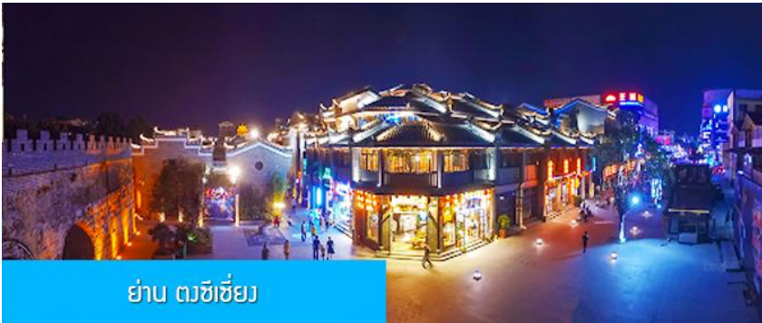
ย่าน ตงซีเจียง

จากนั้นนำท่านเที่ยวชม พิพิธภัณฑ์ดอกกุยฮวา 桂花公社 ดอกกุยฮวาเป็นดอกไม้สีเหลืองที่มีกลิ่นหอม เป็นดอกไม้ประจำเมืองของกุยหลิน จะเบ่งบานในช่วงเดือนมิถุนายน – กรกฎาคมของทุกปี ในช่วงที่ดอกกุยฮวาเบ่งบานในเมืองกุยหลินจะคลุ้งไปด้วยกลิ่นหอมจากดอกกุยฮวา ทั่วเมืองกุยหลินจะเต็มไปด้วยสีเหลืองของดอกกุยฮวา ดอกกุยฮวาสามารถนำมาแปรรูปเป็นอาหารและเครื่องดื่มได้ และได้รับความนิยมจากชาวจีนตอนใต้เป็นอย่างมาก ชมพิพิธภัณฑ์ที่ทันสมัยด้วยระบบจัดแสดงที่ทันสมัย ภายในพิพิธภัณฑ์มีความโอ้อ่า มีการสาธิตและจำหน่ายผลิตภัณฑ์ที่ทำจากดอกกุยฮวา อาทิ ขนมดอกกุยฮวา ชาที่ทำจากดอกกุยฮวา และสินค้าพื้นเมืองอื่น ๆ