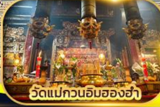
วัดแม่กวนอิมฮ่องฮ่า